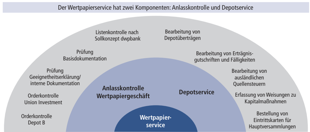
Abb. 1: Umfassender Wertpaperservice

Um Sicherheit in den Abläufen zu gewinnen, legte man gemeinsam eine zweiwöchige Veprobungsphase fest. In dieser Zeit hat die Serviscope die Arbeit aufgenommen, wurde dabei aber von